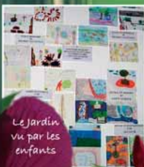
Le Jardin vu par les enfants

De l'arbre " fossile " à l'arbre à chewing gum, de la plante luminescente aux pélargoniums au parfum de chocolat, nous vous attendons pour une passionnante initiation à l'observation des éléments du monde vivant. Nous vous invitons à rencontrer la plante au goût de sucre, les plantes qui s'endorment au toucher ; pour les courageux, osez-vous entrer dans la cage aux plantes carnivores ?